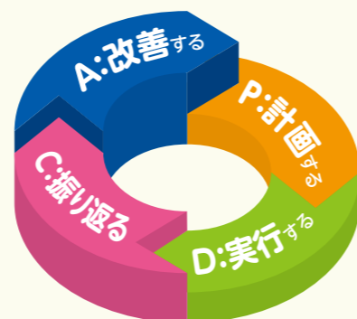
理想的な学習の流れ(学習習慣)

この力は、高校入試への挑戦や自分の希望の将来を実現させるための大きな後押しとなります!